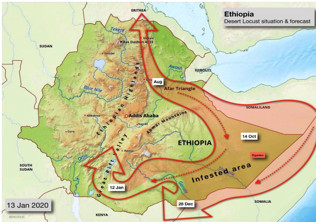
تطور وضع الجراد في الصومال واثيوبيا من اغسطس الى 13 يناير