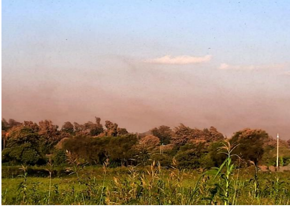
مشهد لسرب كبير من الجراد يصل الى مقاطعة مارسايت، كينيا 17 يناير

أما في كينيا ، كل يوم تصل عدة أسراب غير ناضجة جنسيا وتنتشر غربا في جميع أنحاء المناطق الشمالية والوسطى. وقد شوهدت الأسراب الآن في سبع مقاطعات وهي (واجير، غاريسا، مارسايت، سامبورو، لاكيبييا، إيسولو، ميرو الشمالية) مقارنة بأربع مقاطعات الأسبوع الماضي. وقد بدأت أسراب قليلة بالنضج جنسيا. في الجنوب الشرقي، توجد مجموعات من الحوريات بالقرب من تايتا تافيتا وعلى الساحل والتي يمكن أن تشكل أسرابا في وقت قريب. ومع استمرار جفاف الظروف في بعض المناطق، فمن المتوقع أن تنتشر الأسراب في جميع أنحاء جنوب إثيوبيا وشمال وسط كينيا . ومع أي هطول للأمطار في الأسابيع القادمة سيؤدي إلى النضج الجنسي للأسراب ووضع البيض الذي سيفقس ويؤدي إلى ظهور مجموعات الحوريات خلال شهري فبراير ومارس.