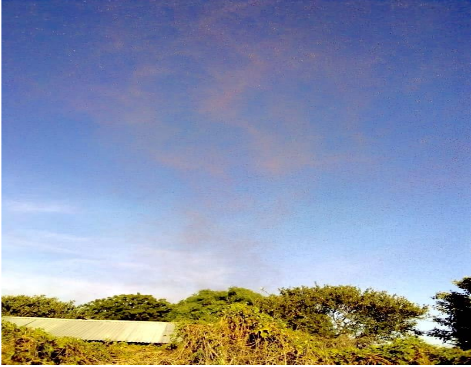
سرب جراد طائر فوق جانيسا، كينيا 22 يناير 2021

وحتى الآن، بدأت أسراب قليلة فقط في النضج جنسيا. في الجنوب الشرقي، تجري عمليات الانسلاخ الاخير بالقرب من تايتا تافيفا، مما تسبب في تكون أسراب صغيرة غير ناضجة جنسيا بينما توجد مجموعات قليلة من الحوريات في الاعمار المتأخرة على إمتداد الساحل.