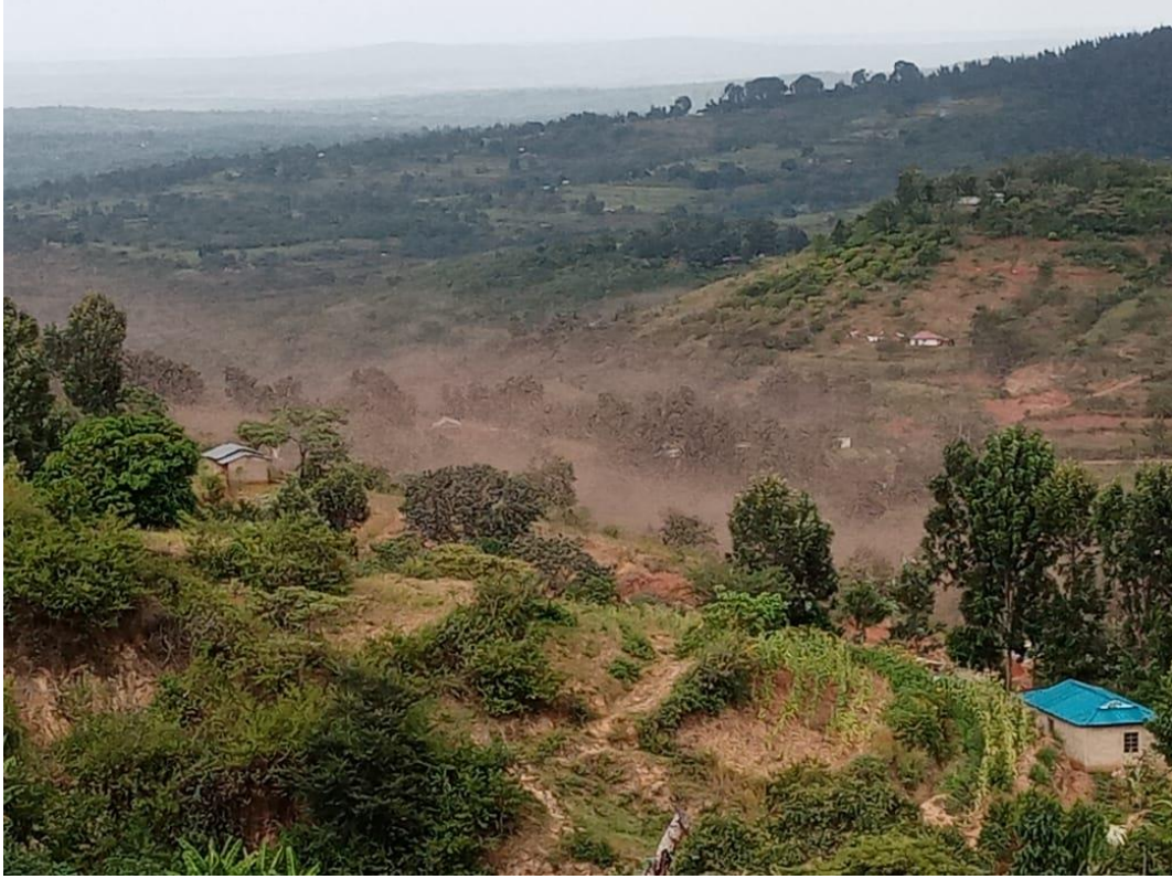
سرب من الجراد الصحراوي المهاجر في مقاطعة ماكويني - كينيا