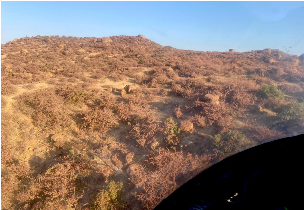
سرب من الجراد الصحراوي المهاجر يغطي الاشجار في مرتفعات جبال هرار - اثيوبيا

في المنطقة الشرقية (إيران، باكستان والهند) و المنطقة الغربية (بلدان المغرب العربي ووسط وغرب إفريقيا) لا يزال الوضع هادئًا.