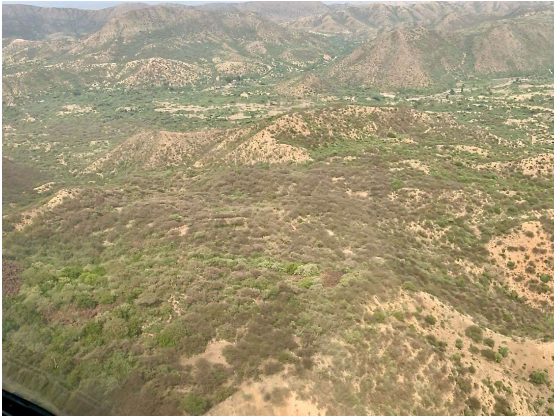
سرب غير ناضج جنسيا مستقر على إمتداد جرف أمهرة غرب تشيفرا ، إثيوبيا (15 يوليو)