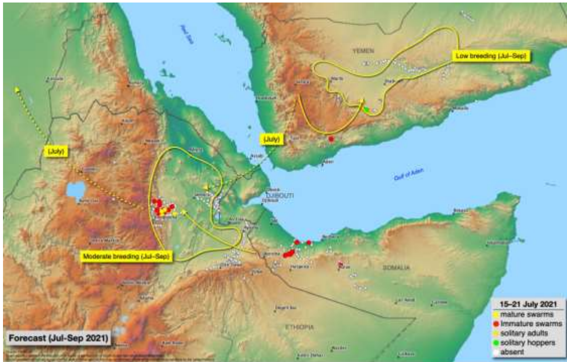
حالة الجراد الصحراوي تحديث 22 يوليو 2021