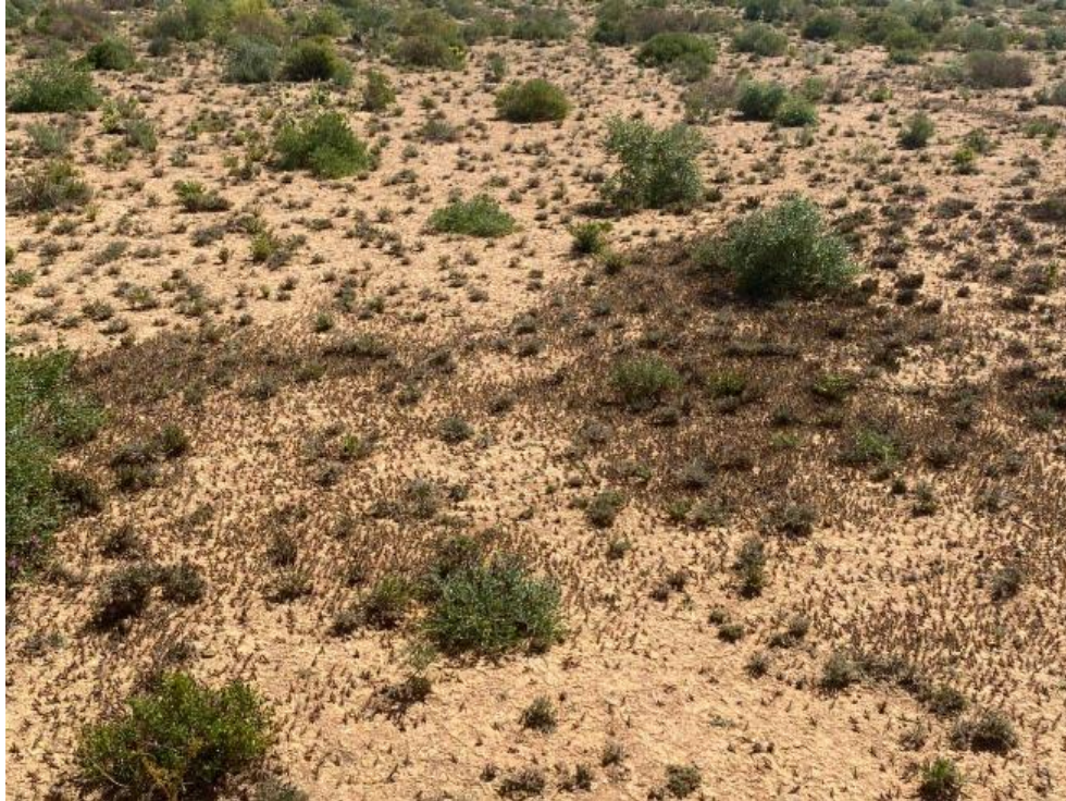
بقع حوريات في شمال شرق الصومال (23 نوفمبر 2021)

عمليات المكافحة مازالت جارية ضد بقع الحوريات الصغيرة في شمال شرق الصومال من التكاثر المحلي. والحشرات الكاملة الانفرادية مازالت متواجدة في شمال غرب الصومال، وتتواجد الاسراب الناضجة جنسيا الصغيرة في جنوب إثيوبيا. ومن المتوقع حدوث تكاثر محدود في إريتريا واليمن.